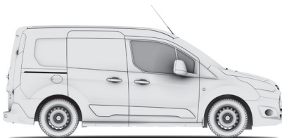
TRANSIT VAN L1