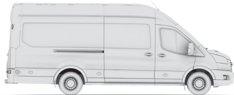
VAN R350L4H3 125 TREND / VAN R470L4H3 155 TREND

3 РОКИ ГАРАНТІЯ АБО 100 тис. км 1 ПРОБІГУ ТОВ «Віннер Імпорту Україна, Лтд», звертайтеся до найближчих офіційних дилерів: Київ: «Віннер Автомобілів» тел.: (044) 496-00-06; «ВіДі Край Моторз» тел.: (044) 591-50-00; «Ніко Форвард Мегаполіс» тел.: (044) 392-11-11; Вінниця: «АВТОВІНН» тел.: (0432) 55-20-20; Дніпро: «Авто-Імпульс» тел.: (056) 747-90-09; «Бристоль-Авто» (056) 732-00-01; 386-30-28; Житомир: «Альфа Моторс Груп» тел.: (0412) 41-93-05; Івано-Франківськ: «Компанія Авто-Альянс» тел.: (0342) 74-22-74; Краматорськ: «Талісман-Авто» тел.: (0626) 46-67-77; Кременчук: «Кременчук – Автосвіт» тел.: (0536) 75-80-10; Львів: «Велет Авто» тел.: (032) 294-31-31, 294-31-34; Маріуполь: «Алекс Схід Маріуполь» тел.: (067) 694-00-91, (050) 423-42-50; Миколаїв: «Терра Моторс» тел.: (0512) 58-14-58; Мукачеве: «Глобал Автоград» тел.: (03131) 3-80-30; Одеса: «Мустанг Моторс» (048) 729-55-55, 729-88-88; Полтава: «Полтава-Автосвіт» тел.: (0532) 61-38-38; Рівне: «Віннер Форд Рівне» тел.: (0362) 64-20-69; Харків: «Авотрейдинг-Схід» тел.: (057) 760-10-50; «Автоцентр Фрунзе» тел.: (057) 714-77-70; Херсон: «Херсон Мотор Компані» тел.: (0552) 41-18-25, 33-70-67; Хмельницький: «Опус-Авто Плюс» тел.: (0382) 75-26-52; Черкаси: «Колос Авто» тел.: (0472) 63-96-12, 63-94-05; Чернівці: «Екомоторс» тел.: (0372) 587-888; Чернівці: «Марп-Авто» тел.: (0462) 93-33-03.