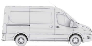
VAN F350L2H2 125 TREND