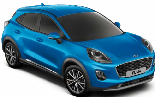
DESERT ISLAND BLUE