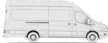
VAN L4H3 (JUMBO 350/470)

VAN - вантажний фургон MWB (Medium Wheel Base - L2) - середня колісна база LWB (Long Wheel Base - L3) - довга колісна база LWB EF (Long Wheel Base Extended Frame - L4 (Jumbo)) - довга колісна база з подовженим кузовом H2 - середній дах, H3 - високий дах RWD - привод на задню вісь