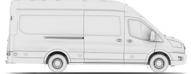
VAN L4H3 (JUMBO 350/470)

VAN - вантажний фургон MWB (Medium Wheel Base - L2) - середня колісна база LWB (Long Wheel Base - L3) - довга колісна база LWB EF (Long Wheel Base Extended Frame - L4 (Jumbo)) - довга колісна база з подовженим кузовом H2 - середній дах, H3 - високий дах RWD - привод на задню вісь