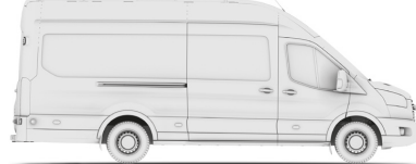
VAN L4H3 (JUMBO 350/470)

VAN - вантажний фургон MWB (Medium Wheel Base - L2) - середня колісна база LWB (Long Wheel Base - L3) - довга колісна база LWB EF (Long Wheel Base Extended Frame - L4 (Jumbo)) - довга колісна база з подовженим кузовом H2 - середній дах, H3 - високий дах RWD - привод на задню вісь