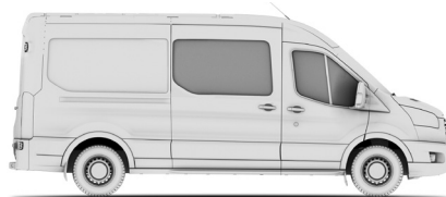
DOUBLE CAB IN VAN L3H2

Kombi – багатощільовий, 9 місць DC IN VAN (Double Cab in Van) – фургон, 6 місць LWB (Long Wheel Base- L3) – довга колісна база H2 – середній дах FWD – привод на передню вісь