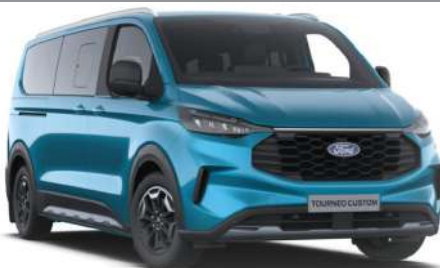
Digital Aqua Blue