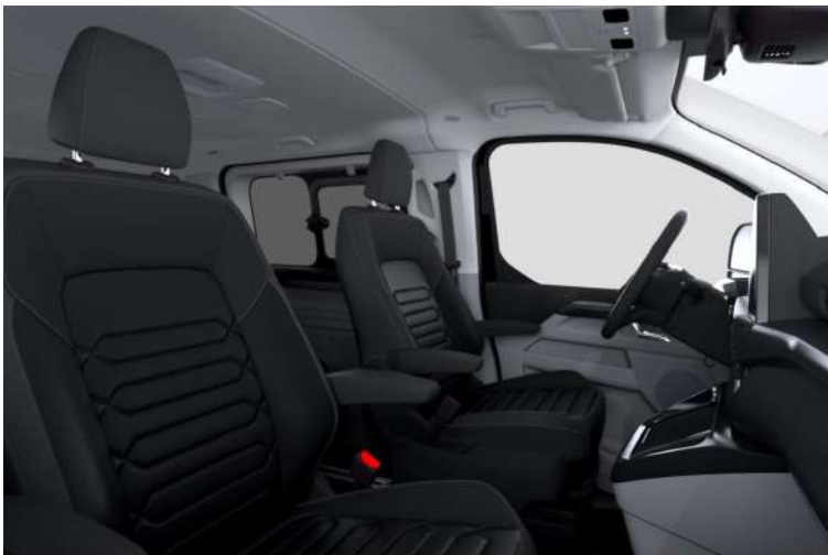
Windsor Style 2, Black Onyx