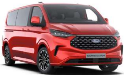
Artisan Red тільки для Titanium / Titanium X