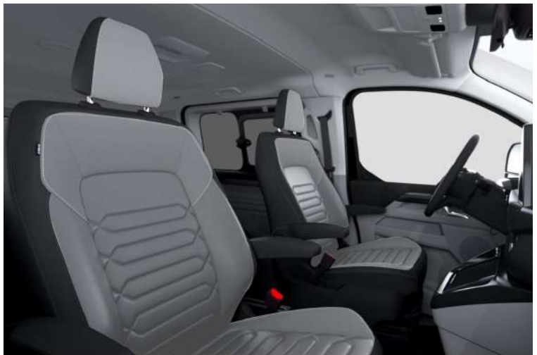
Windsor Style 2, Medium Urban Grey