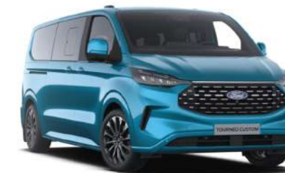
Digital Aqua Blue тільки для Titanium / Titanium X