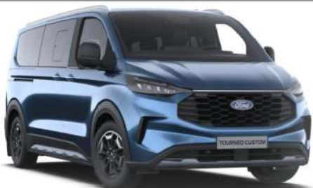
Blue metallic/Chrome Blue