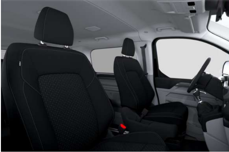
Plus Style 1, Black Onyx