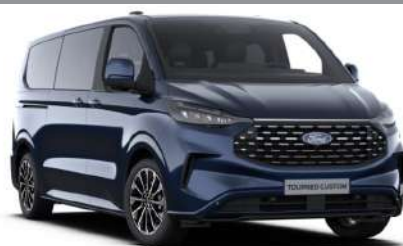
Blazer Blue тільки для Trend