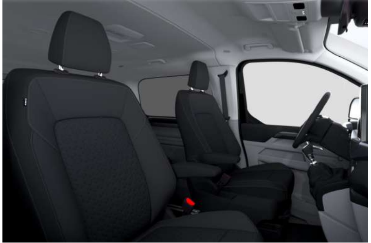
Barlo Style 1, Black Onyx