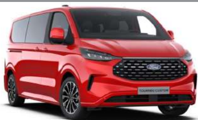
Race Red тільки для Trend