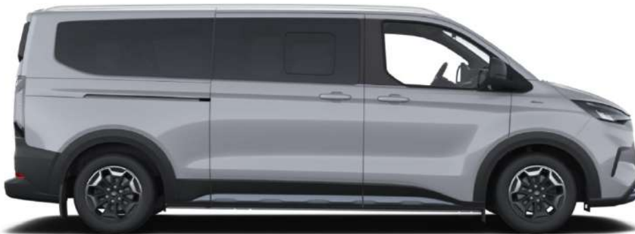
На ілюстрації зображено Tourneo Custom Active L2H1, колір Grey Matter