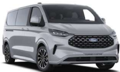
Grey Matter тільки для Titanium / Titanium X