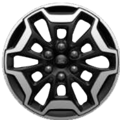
Легкосплавний диск «Active» \varnothing 17 – з елементами кольору Absolute Black (для Active)