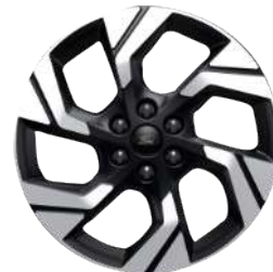
Легкосплавний диск «Active» \varnothing 19 – з елементами кольору Absolute Black (для Active Plus)

Зверніть увагу, що зображений автомобіль на ілюстрації (обладнання, дизайн тощо) може відрізнятися в окремих деталях від фактичного автомобіля (наприклад, показана передсерійна модель та/або створена на комп'ютері). Компанія Ford постійно вдосконалює свою продукцію та залишає за собою право в будь-який час змінити специфікацію автомобіля, кольори та елементи дизайну. Для отримання більш детальної інформації зверніться до дилерського центру Ford.