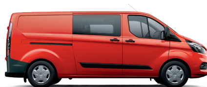
DOUBLE CAB IN VAN L2H1

L2 (LWB - Long Wheel Base) - довга колісна база DC IN VAN (Double Cab in Van) - фургон, 6 місць H1 - низький дах; FWD - привод на передню вісь