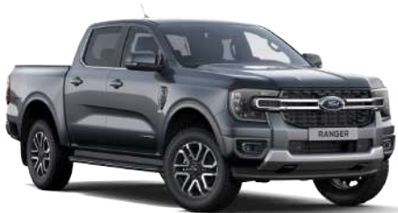
Carbonized Gray/Asher Gray