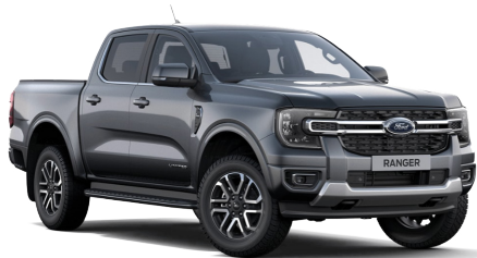
Carbonized Gray/Asher Gray